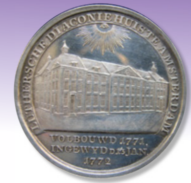
▲ Penning gemaakt ter gelegenheid van de inwijding van De Wittenberg in 1772.

Het Luther Museum Amsterdam opent in 2017 haar deuren; precies 500 jaar na het begin van de Reformatie. Het laat zien hoe het lutheranisme in Amsterdam en Nederland ontstond en hoe het er vandaag de dag uitziet. In de loop der eeuwen hebben de diaconale instellingen tal van kunstvoorwerpen verzameld die een goed beeld geven van wat er in de