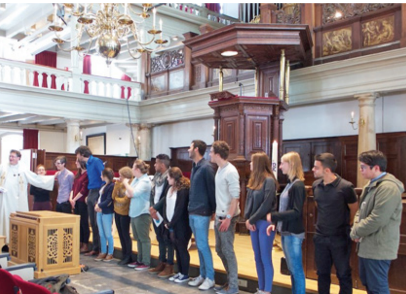
▲ Jongeren van het Mission House ontvangen de zegen.

In het Mission House brengen we (jonge) vrijwilligers uit heel Europa samen onder één dak om diaconaal werk in de stad te doen en te werken aan persoonlijke ontwikkeling. De Diaconie steunt dit project van de Protestantse Kerk in Amsterdam. Jaarlijks verwelkomen we de nieuwe jongeren in de Oude Lutherse Kerk en ontvangen ze een zegen.