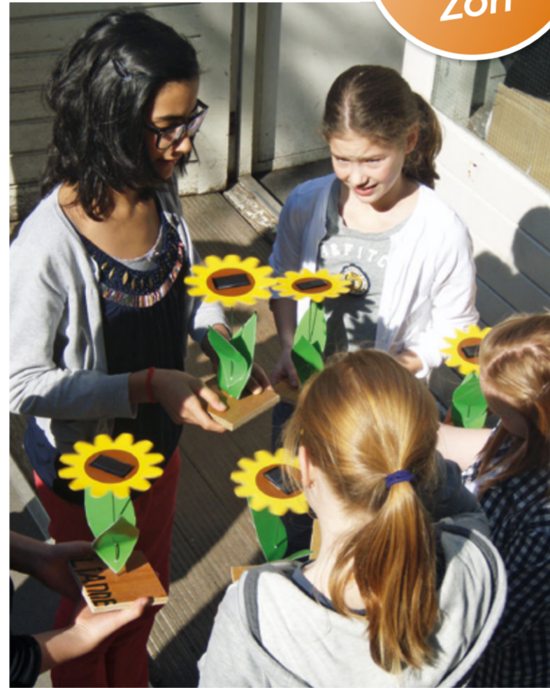
▲ Kinderen leren hoe zonne-energie de wereld verandert.

Het milieuproject voor basisscholen 'Plek onder de zon' startte in februari met de vierde editie. Dit jaar doen er 13 basisscholen uit Amsterdam en Amstelveen mee. De basisschoolleerlingen die deelnemen aan 'Plek onder de zon' leren hoe zonne-energie de wereld verandert. Ze zien hoe een zonnepaneel werkt, hoe het de CO 2 -uitstoot vermindert en hoe zonne-energie kinderen in ontwikkelingslanden kan helpen. Tijdens de feestelijke afsluitingen in juni in de Oude Lutherse Kerk in Amsterdam en in de Amstelveense Kruiskerk presenteren de scholen een eigen uitvinding die op zonne-energie werkt. De winnende school gaat varen met de fluisterboot op het Naardermeer. Deze vierde editie van 'Plek onder de zon' organiseren we samen met het Amsterdams Natuur- en Milieu Educatie Centrum, NME Amsteland-Meerlanden en ontwikkelingsorganisatie Picosol. Als organisaties vinden we elkaar op het inzicht dat werken aan duurzaamheid alleen succesvol is als je het samen met anderen doet. En dat lerende schoolkinderen het verschil kunnen maken in de zorg voor onze aarde.