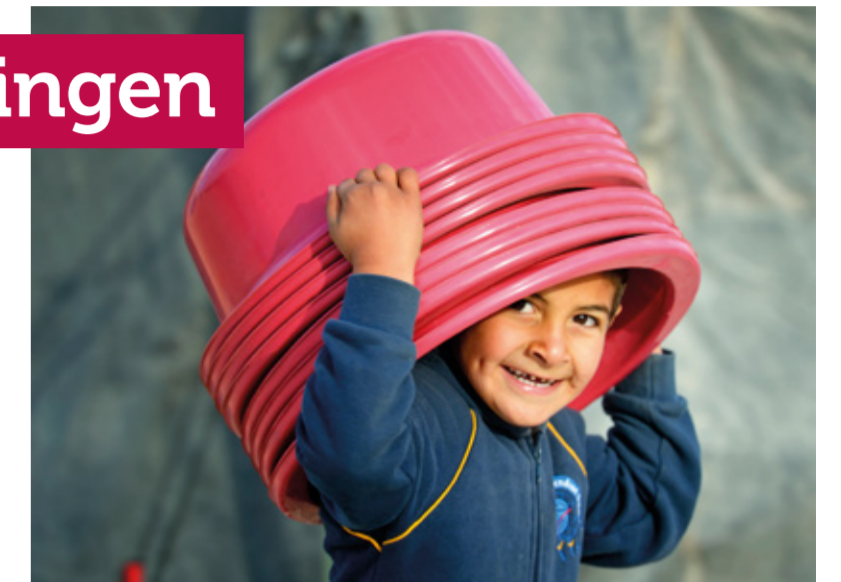
▲ Syrisch jongetje brengt schone teltjes rond in vluchtelingenkamp Za'atari in Jordanië.

Zolang er in onze wereld oorlog, onheil, onderdrukking en armoede is, zullen mensen blijven vluchten. We zien de ontstellende beelden van verdrinkende en geteisterde mensen op de Middellandse Zee voor ons en we kunnen ons daarvan niet afwen-