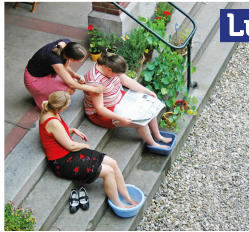
▲ De Lutherhof biedt een beschermde woonomgeving.

Uitgaven 2015: Werkvelden Omzien naar elkaar 32% Stad 51% Landelijk 3% Wereldwijd 14%